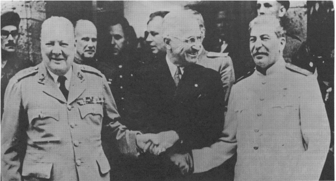
Drei Kriegsverbrecher - Massenmörder beglückwünschen sich zu ihrem Tun in Potsdam 1945: Winston Churchill - Harry Truman - Josef Stalin