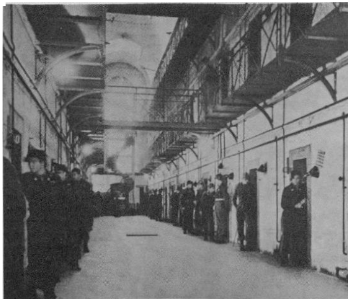
Prominentenbewachung in Nürnberg

..... Sie sollten einmal nach Nürnberg gehen! Dort können Sie einen Justizpalast sehen, in dem 90 % der Anwesenden nur an Strafverfolgung interessiert sind!