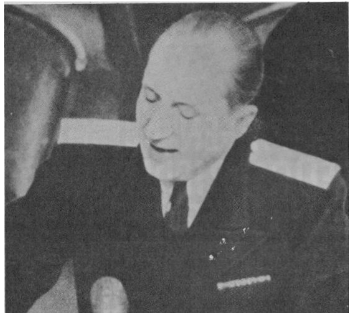
Der sowjetische Hauptankläger Rudenko

Die von der Iswestia verwendeten britisch-französischen Argumente, daß der Krieg verlängert werden müsse, um den Hitlerismus zu vernichten, "lassen uns zu den düsteren Zeiten des Mittelalters zurückkehren, als vernichtende Religionskriege ausgefochten wurden, um Ketzer und Menschen anderer Religion auszurotten"..... "Es ist unmöglich, irgendeine Idee oder eine Meinung mit Feuer und Schwert auszurotten... Man mag den Hitlerismus respektieren oder hassen oder irgendein anderes System einer politischen Meinung. Das ist eine Frage des Geschmacks. Aber einen Krieg zu beginnen zur 'Ausrottung des Hitlerismus' bedeutet, kriminelle Dummheit in der Politik zuzulassen."