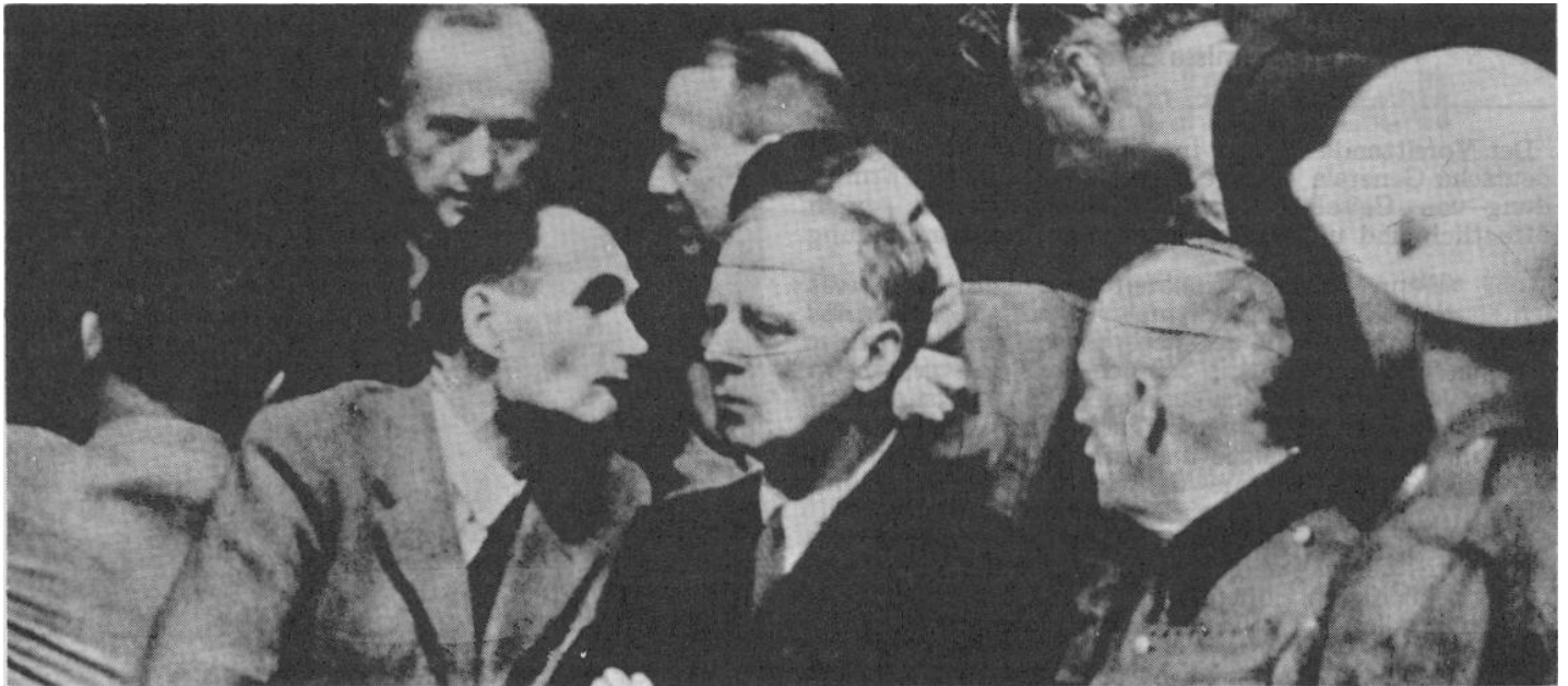
Auf der Anklagebank: v.lks.n.r. Göring, Heß, v.Ribbentrop, Keitel, Dönitz, Raeder, v.Schirach