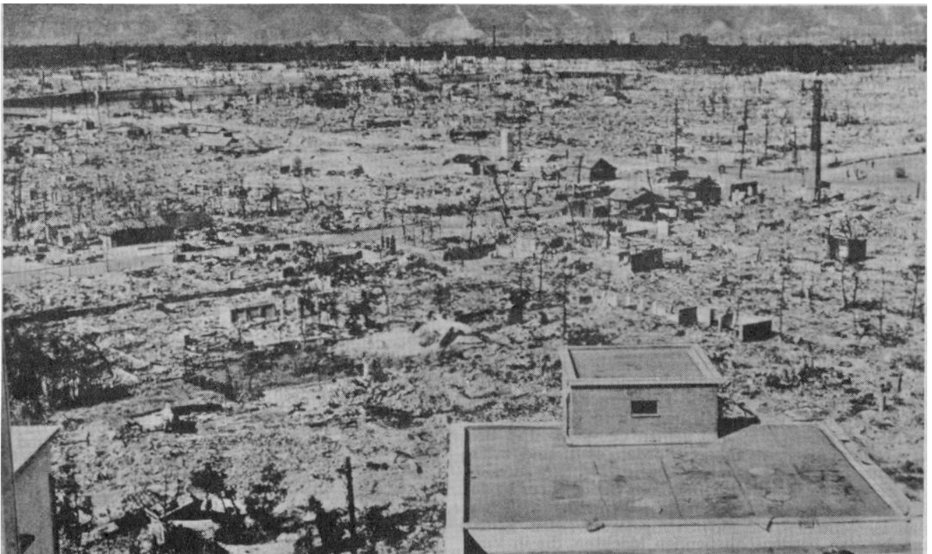
Hiroshima nach dem Atombeschlag im August 1945

Doch in Wirklichkeit hatte das Ganze mit Gerechtigkeit von Anfang an nichts zu tun, dafür umso mehr mit dem umfassenden Programm der "Umerziehung" des deutschen Volkes, wobei es im Prinzip gleichgültig war, wer auf der Nürnberger Anklagebank des "Haupt - Kriegsverbrecher - Prozesses" saß, denn "die ganze Nazi - Philosophie" war angeklagt, und der "Automatic - Arrest" sorgte dafür, daß diese gleiche Art von "Gerechtigkeit" unter grundsätzlicher Ausschaltung jedweder neutralen Beurteilung gegenüber der gesamten Führungselite des deutschen Volkes praktiziert wurde, einschließlich (zum beachtlichen Teil ) auch der Frauen.