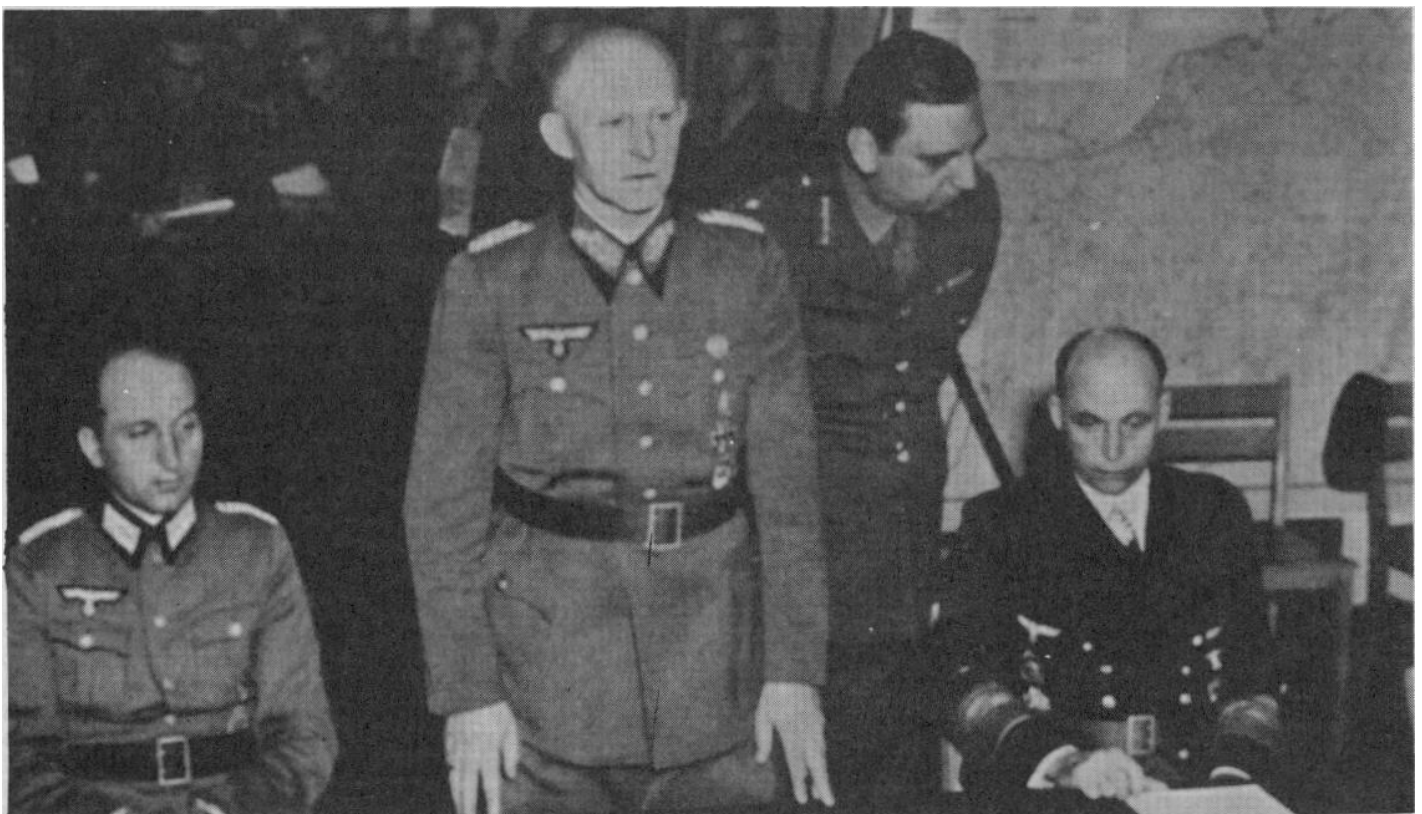
Generaloberst Jodl unterzeichnet die deutsche Kapitulation in Reims