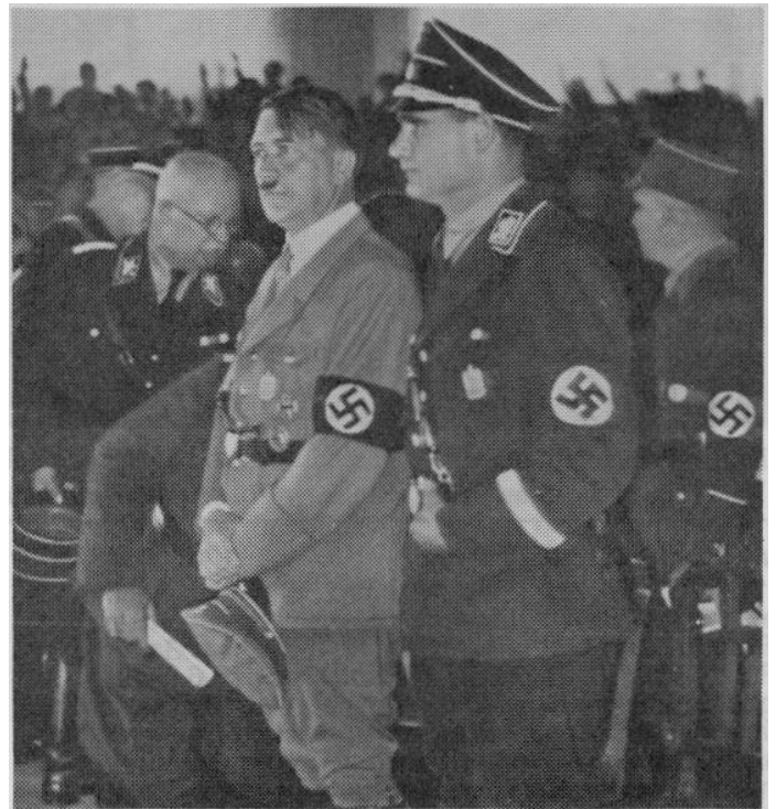
Adolf Hitler und Rudolf Heß auf dem Parteitag in Nürnberg 1933