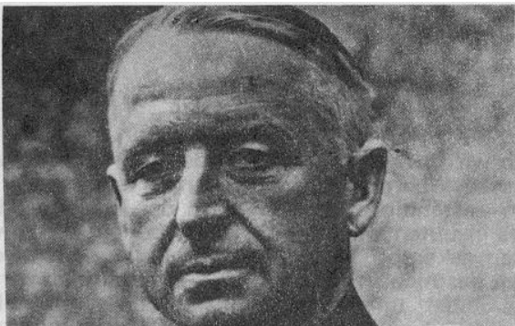
Generalfeldmarschall von Manstein

Wir Historiker sind heute solchen Behinderungen nicht mehr unterworfen wie die Richter des "Internationalen Militär Tribunals". In diesem kurzen Überblick hoffen wir, so umfassend und objektiv wie möglich die irritierende Sachlage von Nürnberg zu prüfen. Wir hoffen, in nüchterner wissenschaftlicher Analyse einen Aspekt der modernen Geschichte zu beleuchten, der schon allzu lange in den Schatten gedrängt war.