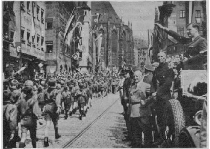
Nürnberg 1933: Pimpfe im Vorbeimarsch vor Baldur v.Schirach und Julius Streicher, beide 1945 unter Anklage vor dem IMT