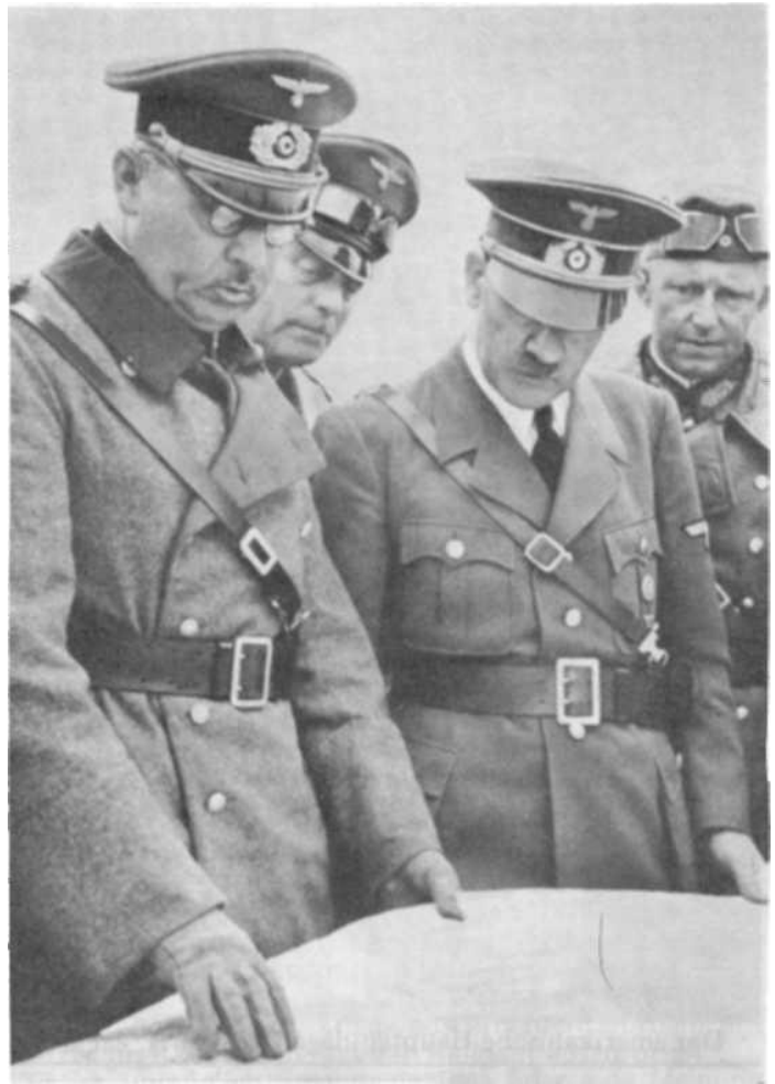
Generaloberst List bei einer Lagebesprechung während des Polenfeldzuges. Anwesend auch die 1946 in Nürnberg hingerichteten Generalfeldmarschall Keitel und Generaloberst Jodl

Um zu einer gerechten Würdigung zu kommen, ist weiter erforderlich, die inneren Verhältnisse zu berücksichtigen, unter denen zu dienen wir gezwungen waren. Wir waren durch unseren Eid und die Gehorsamspflicht gebunden: und wir lebten unter dem Zwang einer sich mehr und mehr dämonisch wie chaotisch gestaltenden Diktatur: in einer Diktatur, in der trotzdem ein starkes Neben- und Gegeneinander herrschte, in der aber dem einzelnen nur geringste Handlungsfreiheit gelassen war; in einer Diktatur, von der sich der Außenstehende keine Vorstellung machen kann, am wenigsten der freie Bürger einer freien Demokratie. Auch können die ganzen Zusammenhänge nicht verstanden werden, ohne einen Blick zu tun auf den Hintergrund des damaligen Geschehens. Gegen uns standen im wesentlichen die glei-