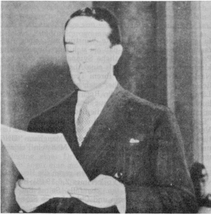
Der britische Hauptankläger Shawcross

land und Litauen, in Polen und Rumänien auch gegen den Willen der genannten Völker an. Roosevelt, der Mann im Hintergrund, hatte bereits am 4. Januar 1939 vor dem Kongreß in Washington erklärt, "die amerikanische Grenze liegt am Rhein", und eine "Politik dicht am Rande des Krieges" befürwortet. Es ist längst unbestrittene wissenschaftliche Erkenntnis, daß Roosevelt eine militärische Auseinandersetzung zwischen Deutschland und seinen östlichen Nachbarn geradezu "wünschte" und später den Kriegseintritt der USA "durch die Hintertür" - Japan - provozierte. England plante 1940 ohne sachbezogenen Anlaß die Invasion in das neutrale Norwegen und wider setzte sich jeglichen Friedensbemühungen, obgleich zugegebenermaßen damals - wie Churchill es später formulierte - ein Friede mit Hitler "für Großbritannien keinerlei Einbuße bedeutet hätte". Stalin schließlich plante und verwirklichte nicht nur den Einmarsch in Polen, Finnland, die baltischen Staaten, Bessarabien und die Bukowina (Teile von Rumänien), sondern begann bereits seine politische Karriere vor und nach 1917 mit der Zielsetzung und in einem Staatssystem, wo Terror, Willkür und Mord gegenüber der einheimischen Bevölkerung wie gegenüber allen anderen Völkern im Sinne "kommunistischer Moral" zum grundsätzlichen Dogma gehörten und die Vernichtung aller anderen Staatssysteme "strategisches Endziel" war.