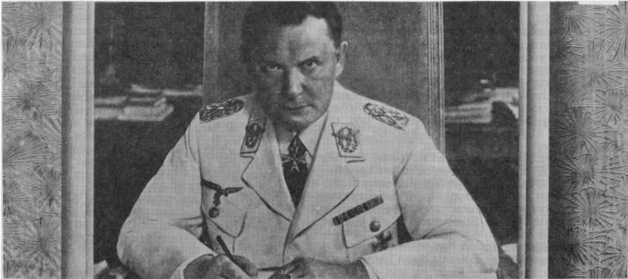
Hermann Görings letzter Brief an Winston Churchill

Daß der nachfolgende Brief Görings an Churchill aus der Todeszelle am 1. Oktober 1946 tatsächlich authentisch ist, hat der britische Historiker David Irving in der "Welt am Sonntag" Nr. 46, 1971 erstmals bestätigt.