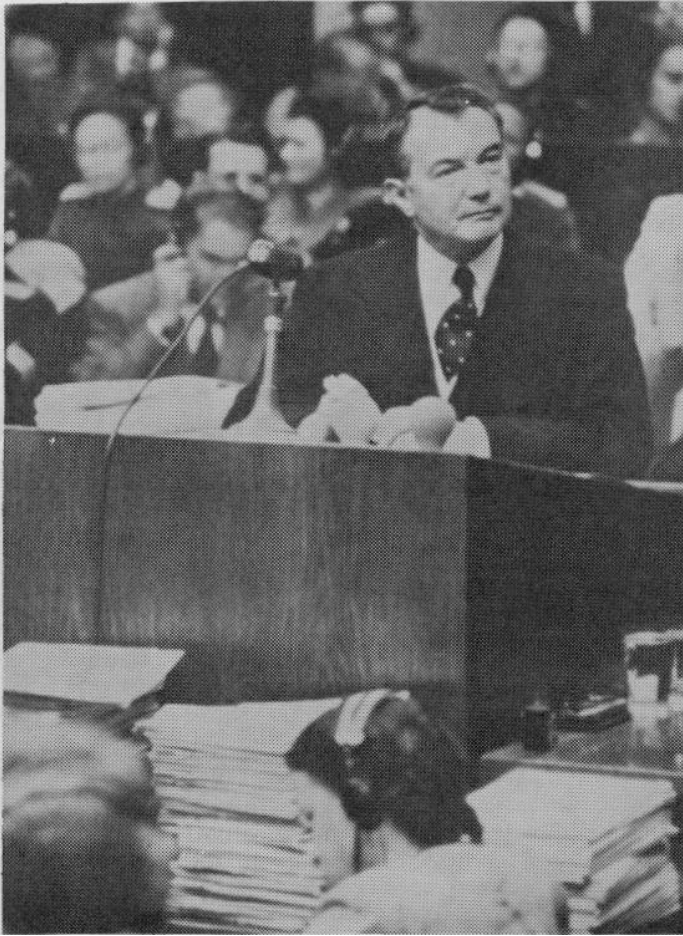
Der amerikanische Hauptankläger Robert H. Jackson