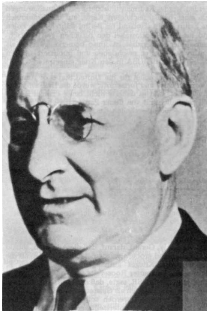
US-Schatzsekretär Henry Morgenthau

lautbarungen, Zeitungsausgaben und Rundfunksendungen. Erneut wurde Deutschland allein für schuldig befunden, den Ersten Weltkrieg angezettelt zu haben, ja 5 Kriege in 80 Jahren. Die Encyclopaedia Britannica strich in ihrer 1944 - Ausgabe jenen Beitrag über die Schuld am Ersten Weltkrieg und fügte statt dessen eine kurze Notiz ein, daß für die Kriegsschuldfrage kein Platz zur Verfügung stünde. Die Geschichte wurde umgeschrieben.