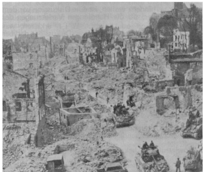
Nürnberg 1945. Erst mit einem so niedergeworfenen Volk konnte man das machen

Nach Version der alliierten Siegermächte: "Kriegsverbrecher" Nr. 1 auf der Auslieferungsliste der Versailler Sieger - Generalfeldmarschall von Hindenburg, seit 1925 Reichspräsident der Weimarer Republik, mit Adolf Hitler "Nr.1" der Nachfolgeliste für den Zweiten Weltkrieg