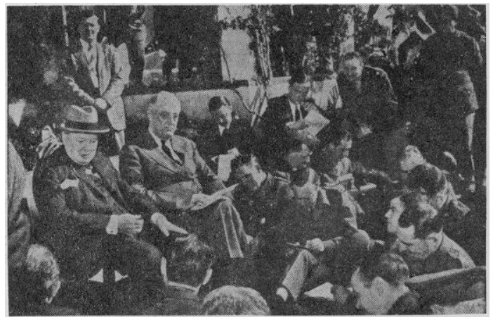
Pressekonzferenz in Casablanca, Januar 1943, bei der Roosevelt und Churchill die "Bedingungslose Kapitulation" proklamierten

In den USA entwickelte sich der Chor der Forderungen für Prozesse gegen die "Nazi - Führer" vorwiegend außerhalb der haßgeschwängerten Kampagne, die von verschiedenen offiziellen sowie halboffiziellen Propaganda - Agenturen vorwärtsgetrieben worden war. Zu Beginn des Krieges schätzte das amerikanische Volk die Deutschen als ein recht gut zu leidendes Volk ein, das jedoch vom Tyrannen Hitler in den Krieg hineingetrieben worden sei. Eine solche Grundeinstellung widersprach jedoch auch noch den Plänen Washingtons, deutsche Zivilisten mittels Tages- und Nachtbombardements dem Massenmord auszuliefern. Auch würde die amerikanische Öffentlichkeit nicht so ohne weiteres die Degradierung und Erniedrigung der Deutschen nach der Niederlage des Nationalsozialismus hingenommen haben.