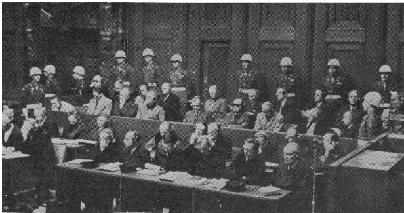
Die Angeklagten im Nürnberger Hauptprozeß: Vordere Reihe v. lks. n. r. Göring, Heß, v. Ribbentrop, Keitel, Rosenberg, Frank, Frick, Streicher, Funk, Schacht,

1.) Sein Verteidiger war ein sich freiwillig zur Verfügung stellendes britisches Parlamentsmitglied, Rechts-