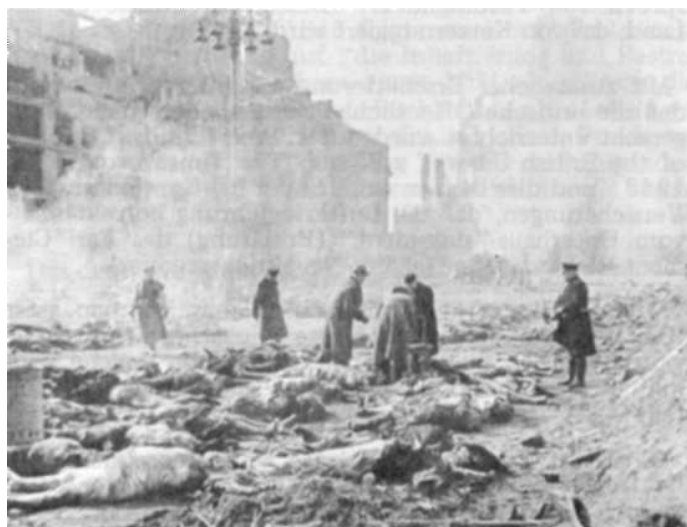
Massenmord in Dresden noch lange danach mußten die Leichen verbrannt werden

Kriegspremier Winston Churchill erklärte am 2.6. 1942 im Unterhaus: "Ich darf sagen, daß mit dem Fortschreiten des Jahres die deutschen Städte, Häfen und Zentren der Kriegsindustrie einer Prüfung unterliegen werden, wie sie kein Land ..... jemals erfahren hat."