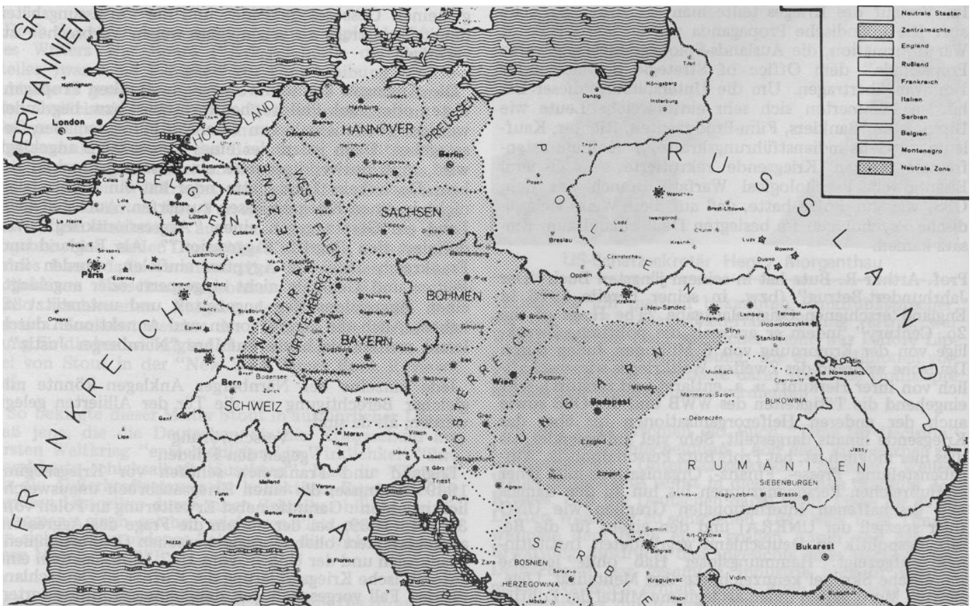
Französische Kriegszielkarte aus dem I. Weltkrieg : "Oder - Neiße" - Linie als Grenze zwischen Deutschland und Polen. Es bedurfte nur noch eines weiteren Vorwandes.

ung "bezeichnen" und unter diesem Vorwand gegen Deutschland militärisch vorgehen sollte. Doch es geht noch weiter: England und Frankreich boten am 22.8.1939 den Sowjets den Einmarsch in Estland, Lett-