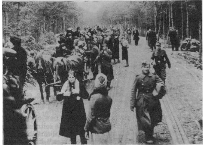
Flüchtlings-Vertreibungstreck Jan./Febr. 1945 im Raum von Braunsberg

Doch wichtig für uns ist zu wissen, daß alle jene Massenmorde, Entrechtungen, Wilderermethoden die "legalen" Maßnahmen jener waren, die auch in Nürnberg dieses gleiche "Recht" sprachen. Moral und Weltöffentlichkeit störten sie dabei nicht, ihre Skrupel waren schon lange vorher abgelegt, - sie hatten ja die Macht, und das reichte.