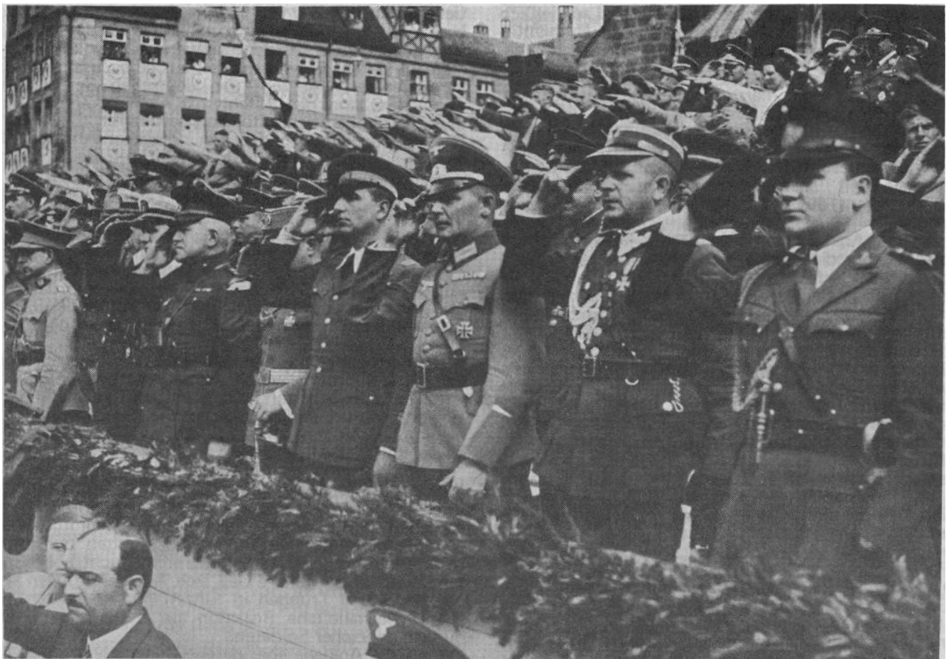
Ausländische Militärattaches auf dem Parteitag in Nürnberg 1934

Das Korps der Politischen Leiter der NSDAP, soweit ihre Mitglieder Leiter von Büros im Stabe der Reichslei-