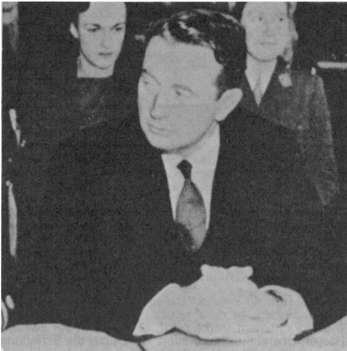
Der französische Ankläger Dubost

Doch das reichte nicht, um alle jene "zu bestrafen", die man zu bestrafen wünschte. Neue, weitere Formulierungen mußten gefunden werden.